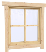
0.87×0.78 м.1 шт.