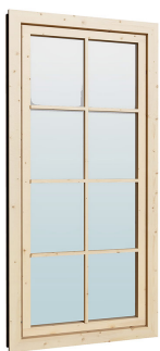
0.84×1.885 м.2 шт.