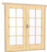
1.62×1.885 м.1 шт.

7. Наличники: сухая строганная доска 20×100 мм.;