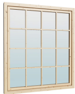
1.62×1.885 м.4 шт.