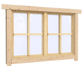
1.34×0.91 м.1 шт.